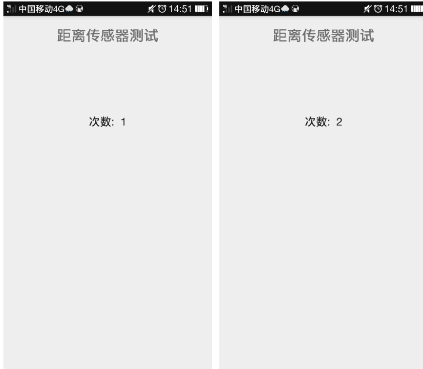
图× App 计数运行的界面